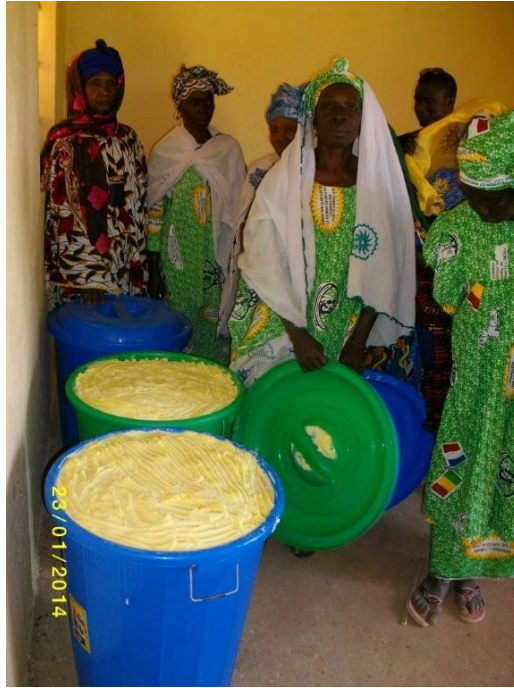
Beurre de karité produit par la coopérative des femmes de Sandama