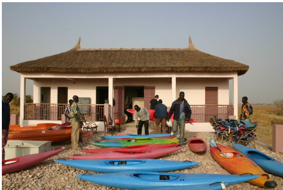
A Somonosso, au bord du fleuve Niger

Trois jeunes locaux ont été formés en France, à la base nautique de Bellecin dans le Jura, et ont reçu leur diplôme de moniteur de la Fédération Française de Canoë-Kayak. Une coopérative composée de onze jeunes a ensuite été constituée et équipée de nombreux matériels.