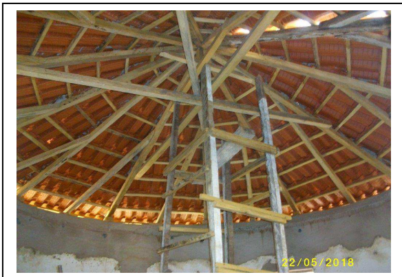
Case en cours de réfection

Le projet de réfection de la case d'accueil a été réalisé et finalisé en 2018. Le propriétaire de l'hôtel Kamadjan (où est située la case) a fait proposition de rénovation et coût qui a été validé par Calao lors de la mission de Février 2018.