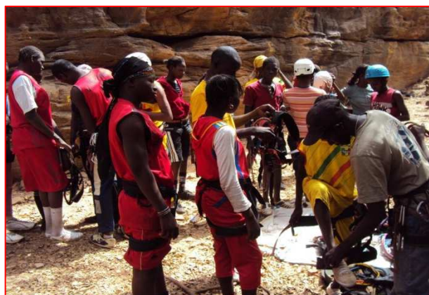
Une école malienne découvre l'escalade au Parc National de Bamako.

Les jeunes de la coopérative d'escalade de Siby rencontrent des problèmes de fréquentation du public en particulier des scolaires depuis les difficultés constatées au Mali. Dans l'optique de trouver d'autres sources de revenus, il a été négocié avec le parc National de Bamako l'aménagement d'un lieu d'initiation à l'escalade dans l'enceinte du parc.