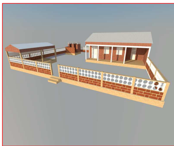
Le projet de construction