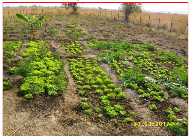
Le terrain de maraîchage