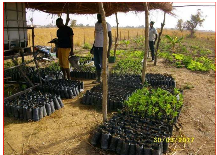
Les premiers semis

Parallèlement à l'activité pépinière l'équipe a pu produire et vendre des légumes leur assurant rapidement des revenus. A ce jour nous avons pu constater par l'intermédiaire de notre partenaire local AKT, qui en assure le suivi, que les jeunes s'investissent pleinement dans leur nouvelle activité.