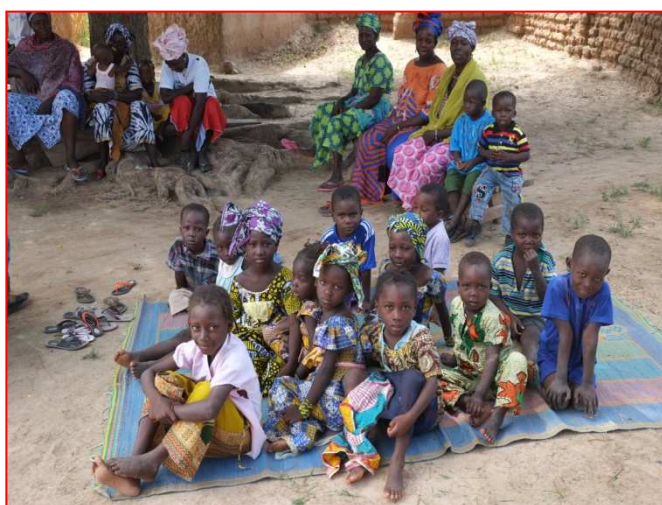
Le clos d'enfants de Djiguidala

Après des réunions préparatoires avec les autorités locales et la constitution d'un Comité de Gestion Scolaire « CGS », qui administrera la future école, un appel d'offres a été lancé auprès de trois entreprises de construction. L'une d'elles a été sélectionnée et les travaux doivent démarrer d'ici la fin octobre 2017.